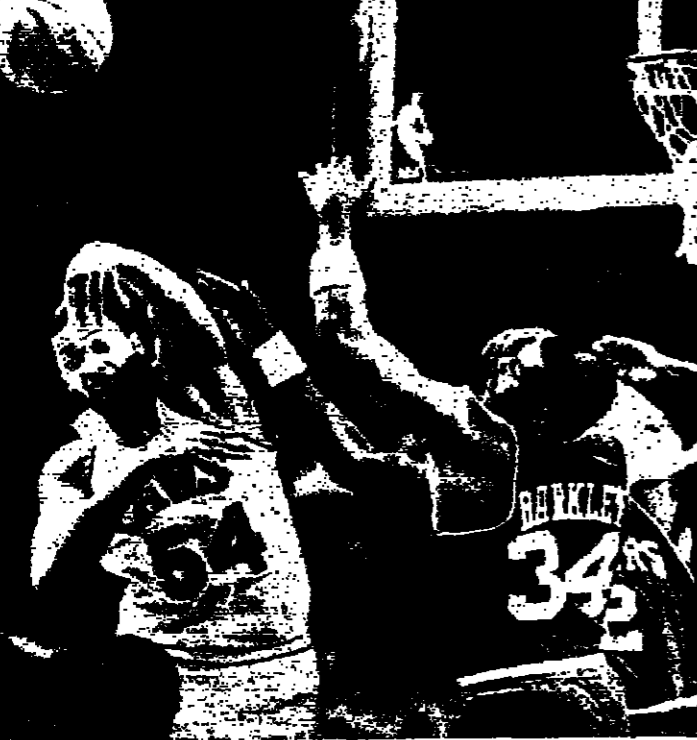
لقطة من لقاء كليفلاند كليفلين ضد فيلادلفيا في اطار تصفيات الدوري الاميركي لكرة السلة...